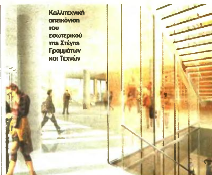
Καλλιτεχνική επεξεργασία του εσωτερικού της Στέγης Γραμμάτων και Τεχνών

Η σημερινή κοινωνία έχει εγκαταλείψει τη φιλοσοφία, την επιστήμη, και την τέχνη. Άνθρωποι που μισούσαν την επιστήμη έδωσαν τη χαρακτηριστική βολή στη φιλοσοφία του 20ού αιώνα, αφήνοντας έναν σκέτο νυχλιμό