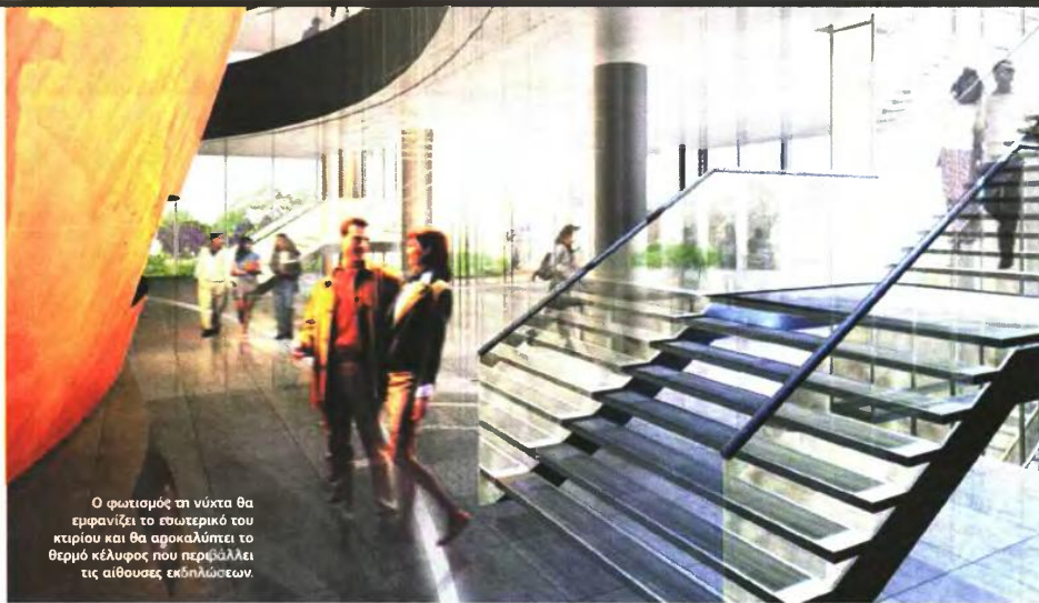
Ο φωτισμός τη νύχτα θα εμφανίζει το εσωτερικό του κτιρίου και θα αποκαλύπτει το θερμό κέλυφος που περιβάλλει τις αίθουσες εκδηλώσεων.