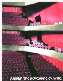
Άποψη της κεντρικής σκηνής.

ΚΑΦΕ, ΜΠΑΡ, ΕΣΤΙΑΤΟΡΙΑ: Το κτίριο διαθέτει ιδιαίτερος και καλοήθους χώρους εστιατορίου, καφέ και μπαρ. Το τελευταίο σχεδίασε η καταξιωμένη εικαστικός Αιμιλία Παπαφίλιππου, η οποία αντιμετώπισε το χώρο ως συνολικό έργο τέχνης. Επίσης, μικρότερης κλίμακας χώροι αναπτύσσονται σε όλη την έκταση του κτιρίου, το οποίο διαθέτει ακόμα υπόγειους χώρους αποθήκευσης και parking.